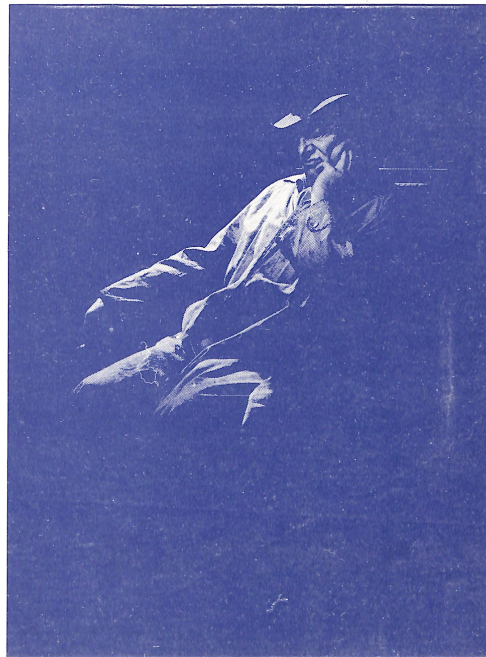
АТАНАС НАШОКУ II НАГРАДА ЗА ФОТОГРАФИЈА – ЧОПЕЛА